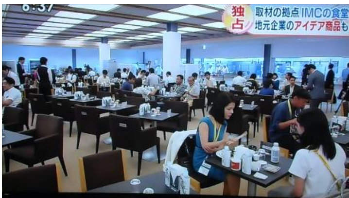
600人が一度に食事ができるメインダイニング