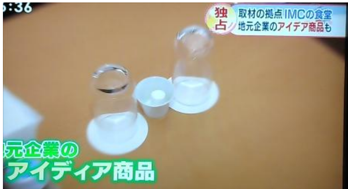
地元企業のアイデア商品として紹介

「G2TAM」コインおしぼりは、三重県が各国政府やメディア関係者に差し上げるお土産(おもてなしバッグ)にも入っています。