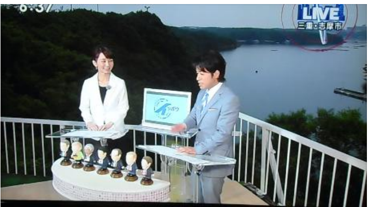
メインキャスターによる「G2TAM」コインおしぼり紹介のコメント