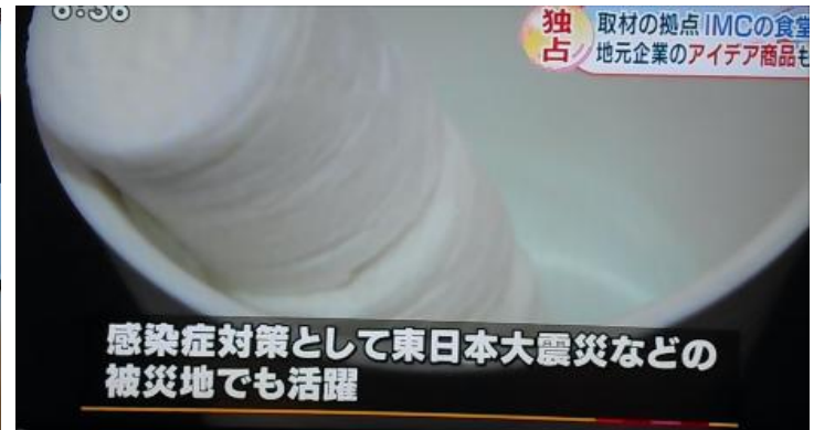
東日本大震災などの被災地でも活躍 但し、ノロウイルス対策のコメントはミスリード