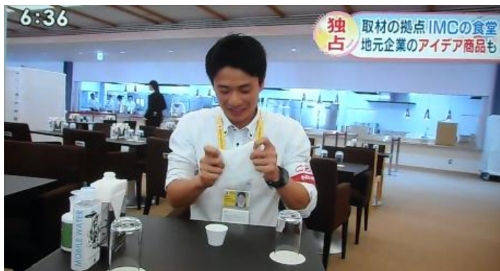
テレビ局のアナウンサーが使い方を解説