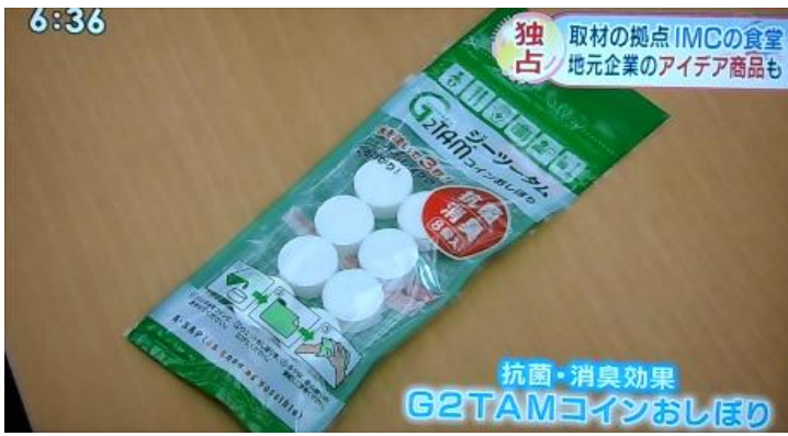
「G2TAM」コインおしぼりを大写で紹介