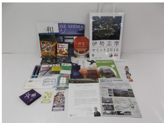
三重県が来訪者に贈った「おもてなしバッグ」