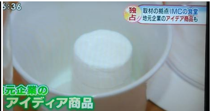
全てのテーブルに「G2TAM」コインおしぼりが用意されています