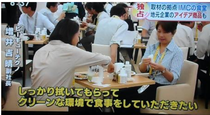
ダイニングで「G2TAM」コインおしぼりを使用している映像